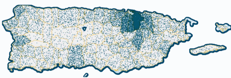
● 1 punto equivale a 1 OSFL

Implica el crecimiento sostenible, la creación de empleo, la infraestructura sólida y la inversión en educación y salud, con el objetivo de alcanzar un nivel de vida más alto y una mayor estabilidad económica.